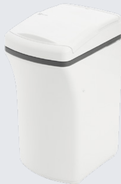
Electrolux Descalcificador 18L

Con el descalcificador de alta eficiencia Electrolux, protege su instalación y electrodomésticos de los daños causados por el agua dura y ahorra energía.